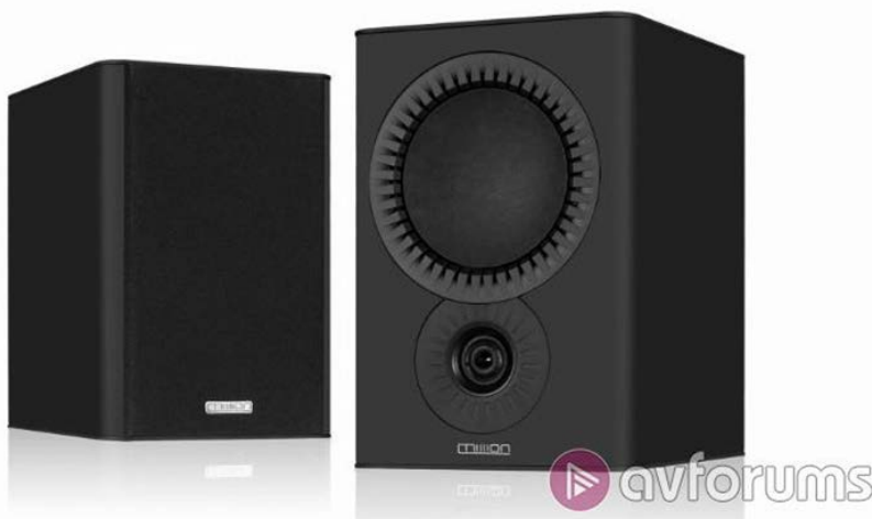
The looks are largely unchanged from the MkI

«Ничего в этой новой версии MkII не должно вызывать у вас немедленного желания выкинуть старую. Это просто эволюция талантливой колонки, которая делает ее немного лучше. Она принимает вызов вновь прибывших на рынок моделей, таких, например, как Triangle Borea BR03, и, хотя некоторые навыки Triangle сочетаются с некоторыми другими достоинствами, трудно утверждать, что в результате получилась действительно хорошая акустика. Эволюция Mission от ободряюще забойной, энергичной и бюджетной системы до технологически продвинутого сектора в портфолио группы IAG – это именно то, что дает потрясающие результаты. Конструкторы взяли выдающиеся акустические системы и сумели сделать и еще лучше в версии QX-2 MkII. Результат можно рассматривать только как бесспорно выгодную покупку – Best Buy!»